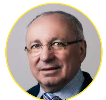
Hans Schrammel Bürgermeister Hans Schrammel

In diesem Sinne freuen wir uns auf die Entstehung unseres Raumplanungskonzeptes im gemeinsamen Austausch mit Ihnen und wünsche Ihnen persönlich alles Gute!